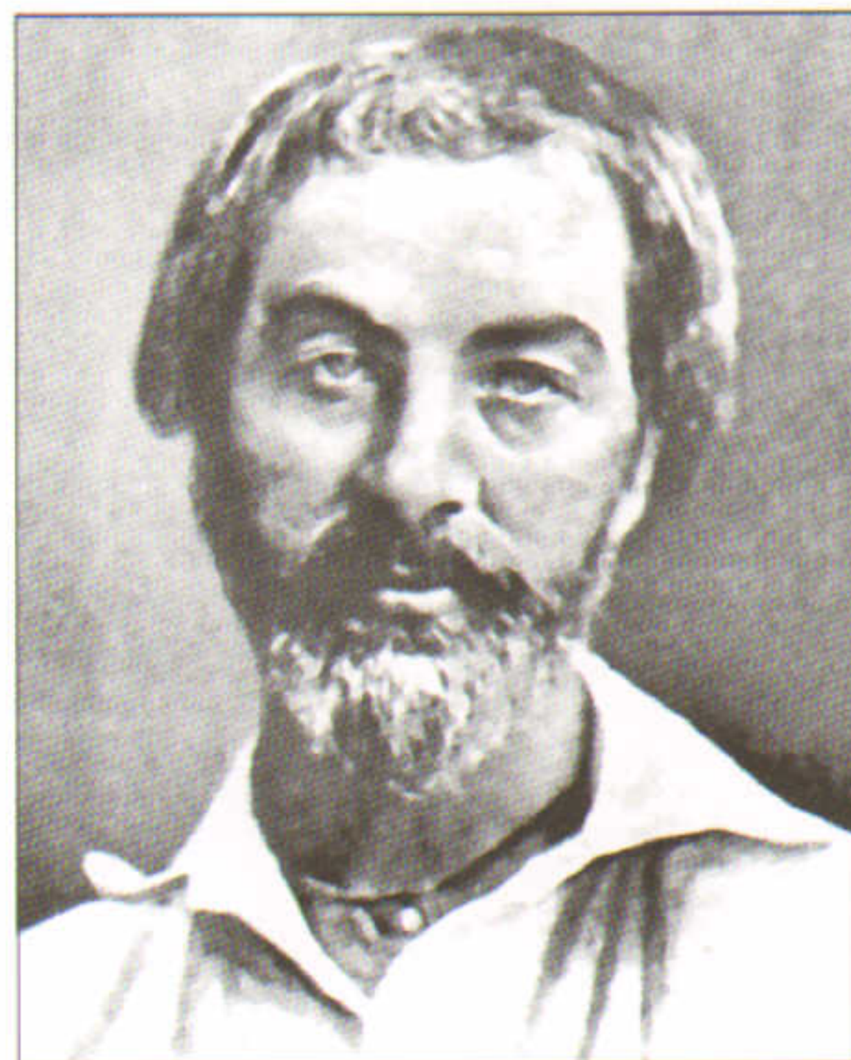
Walter Whitman (1891-1892)

Yn dair ar ddeg oed, bu'n gweithio fel prentis i argraffydd y Long Island Patriot , ac yna i Swydd Suffolk (Swydd Nassau Heddiw), Efrog Newydd, a bu yno o 1836 i 1841. Yn ddiweddarach, daeth yn newyddiadurwr gyda deg neu ragor o bapurau newydd a chylchgronau. Y pwysicaf ohonynt oedd y Democratic Review , y bu â chysylltiad ag ef o 1841 i 1848.