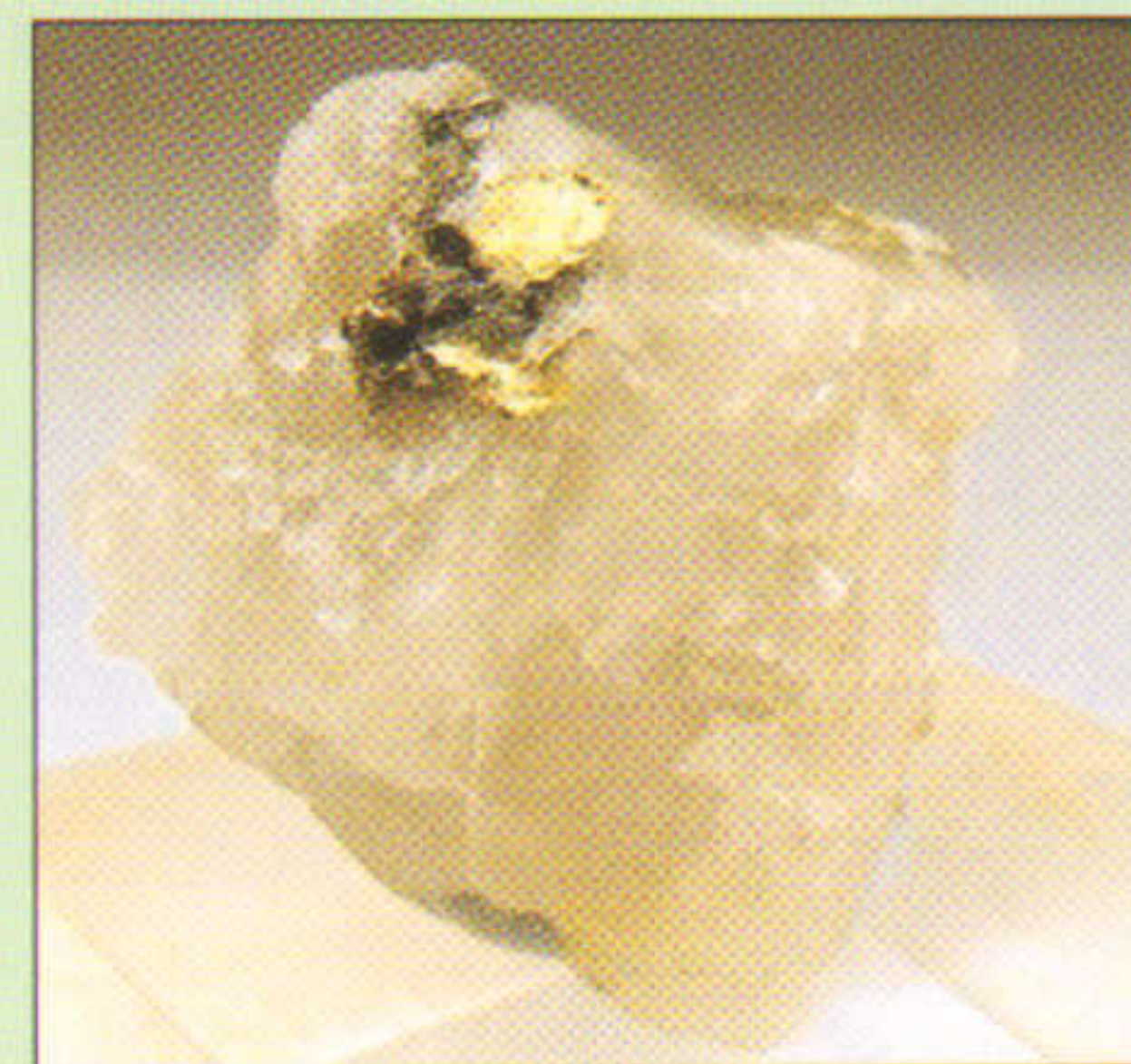
Aur y Clogau, Dolgellau

Ceir morgwn yn y dyfroedd hyn. A yw'r ddelwedd ar y sgrîn yn adlewyrchu'r gwirionedd, ynteu a yw'r gwerthwr wedi defnyddio golcuadau lliw wrth dynnu'r llun? Ai emrallt mewn calsit yw hwnnw, ynteu darn o wydr wedi'i ludo ar sment? Os yw mwn neilltuol yn brin, ac felly'n ddrudfawr, a fydd ei werth yn plymio os canfyddir cyflenwad enfawr ym Moroco yfory nesaf? A yw'r pris yn fargen, yn rhesymol, ynteu'n ddigywilydd? Beth sydd ar gynnig yn yr arwerthiannau arlein heddiw? A feiddiaf innau gynnig? Neu fentro gwerthu? Pwy yw'r lembo hwnnw sy'n cynnig yn f'erbyn?