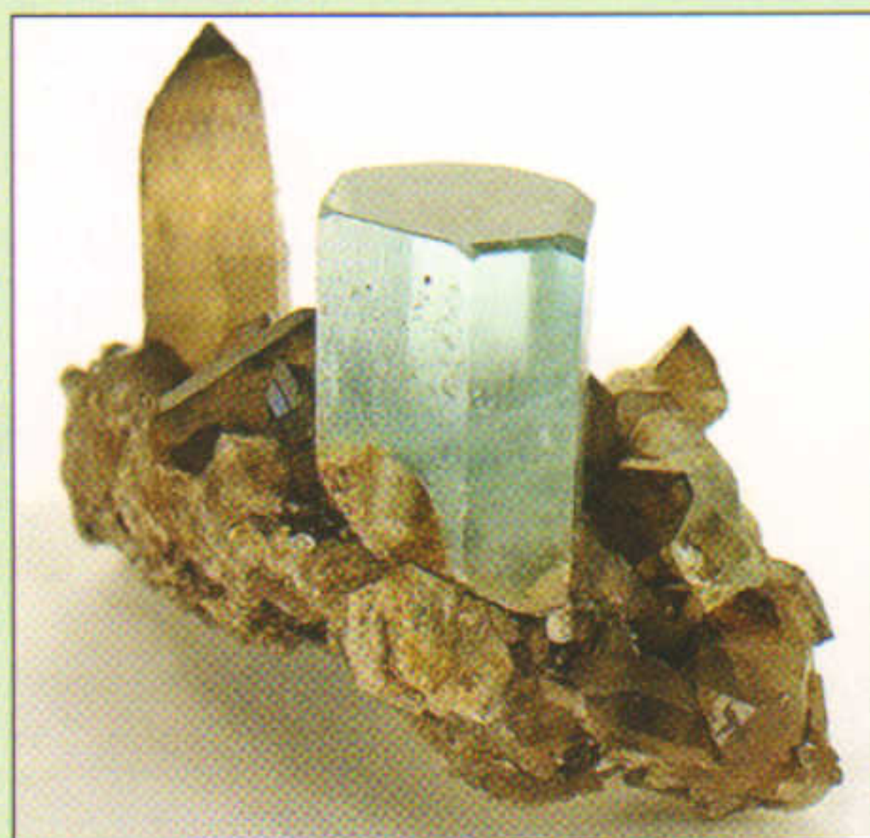
Morlasfaen o Namibia

Bûm innau'n casglu mwynau ers fy mhentyndod, ac y mae Cymru'n lle da ar gyfer hynny. Y mae yma amrywiaeth fawr o greigiau, faint a fynir o fwynau, a llawer o gloddio a thyllu er mwyn eu dwyn i olwg. Aur Dolaucothi, copr Môn, plwm Ceredigion, calsit Ffynnon Taf, fflŵorit Dyserth, manganis Llŷn... y mae'n rhestr faith. Ond oni bai i rywun wybod ym mha le'n union i'w canfod, neu wynebu gwaith hynod beryglus mentro i hen weithfeydd, rhaid dibynnu ar werthwyr: a phrin yw'r rheiny yn y wlad hon y ceibiwyd cymaint o gyfoeth o'i chrombil.