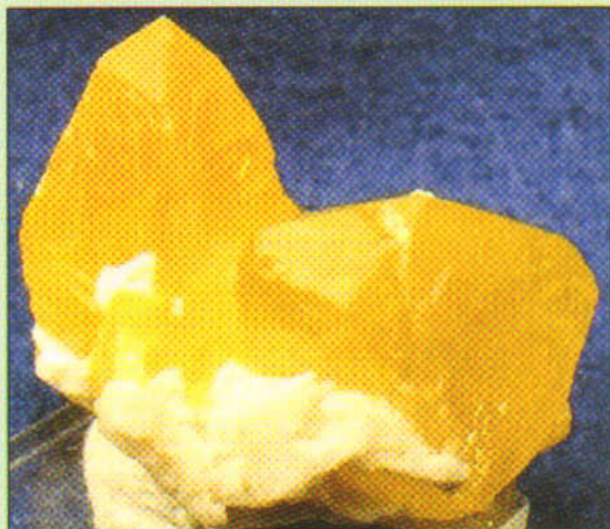
Brwmstan yr Eidal

Gyda chymaint o amrywiaethau, 'does diben casglu popeth: felly'r duedd yw arbenigo mewn rhyw nodwedd neu'i gilydd. Arbenigo o ran sylweddau: ffosffadau, sylffadau, neu elfennau pur, er enghraifft. Arbenigo o ran