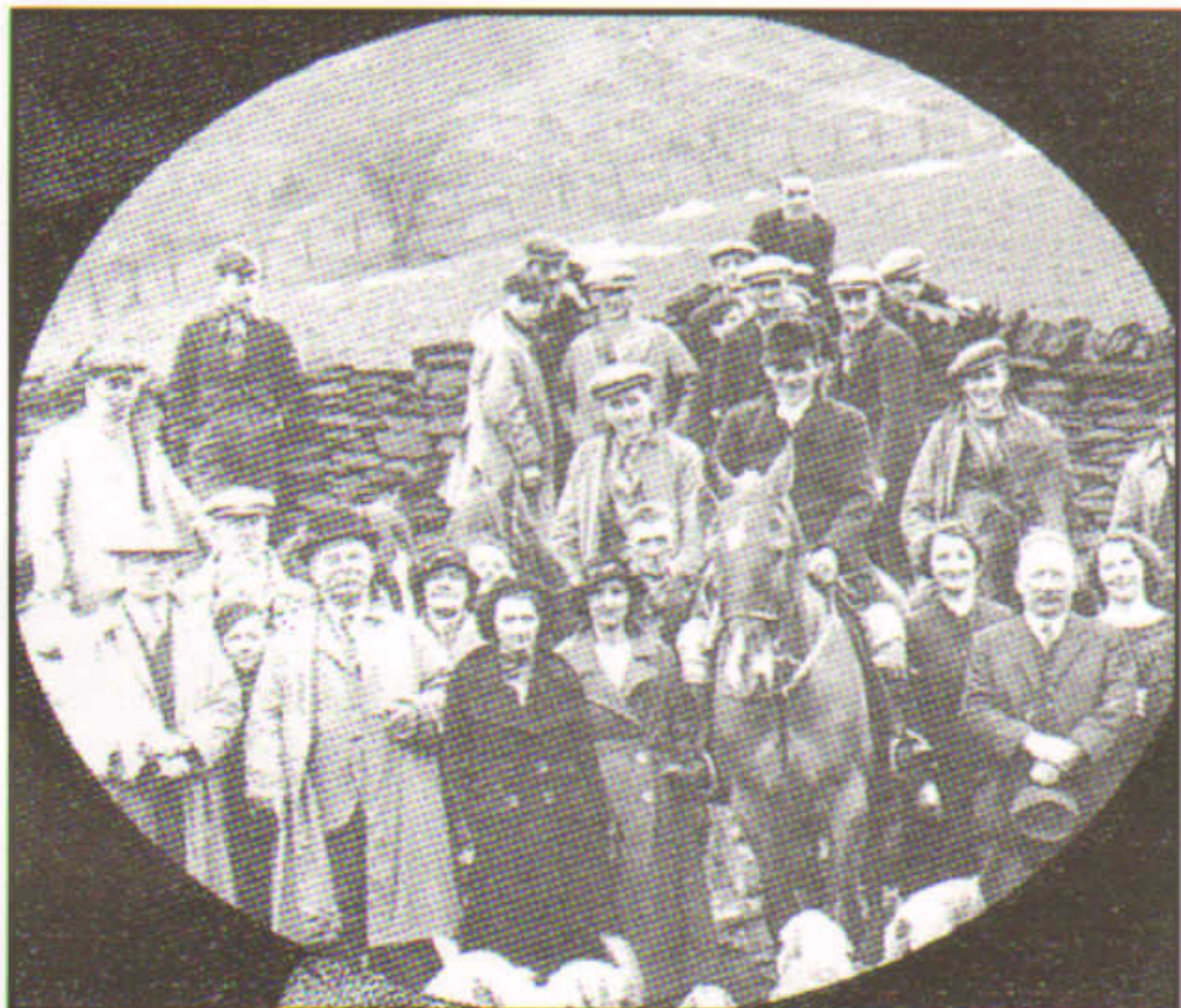
Yr Helfa ym Mlaenrhondda, oddeutu 1930