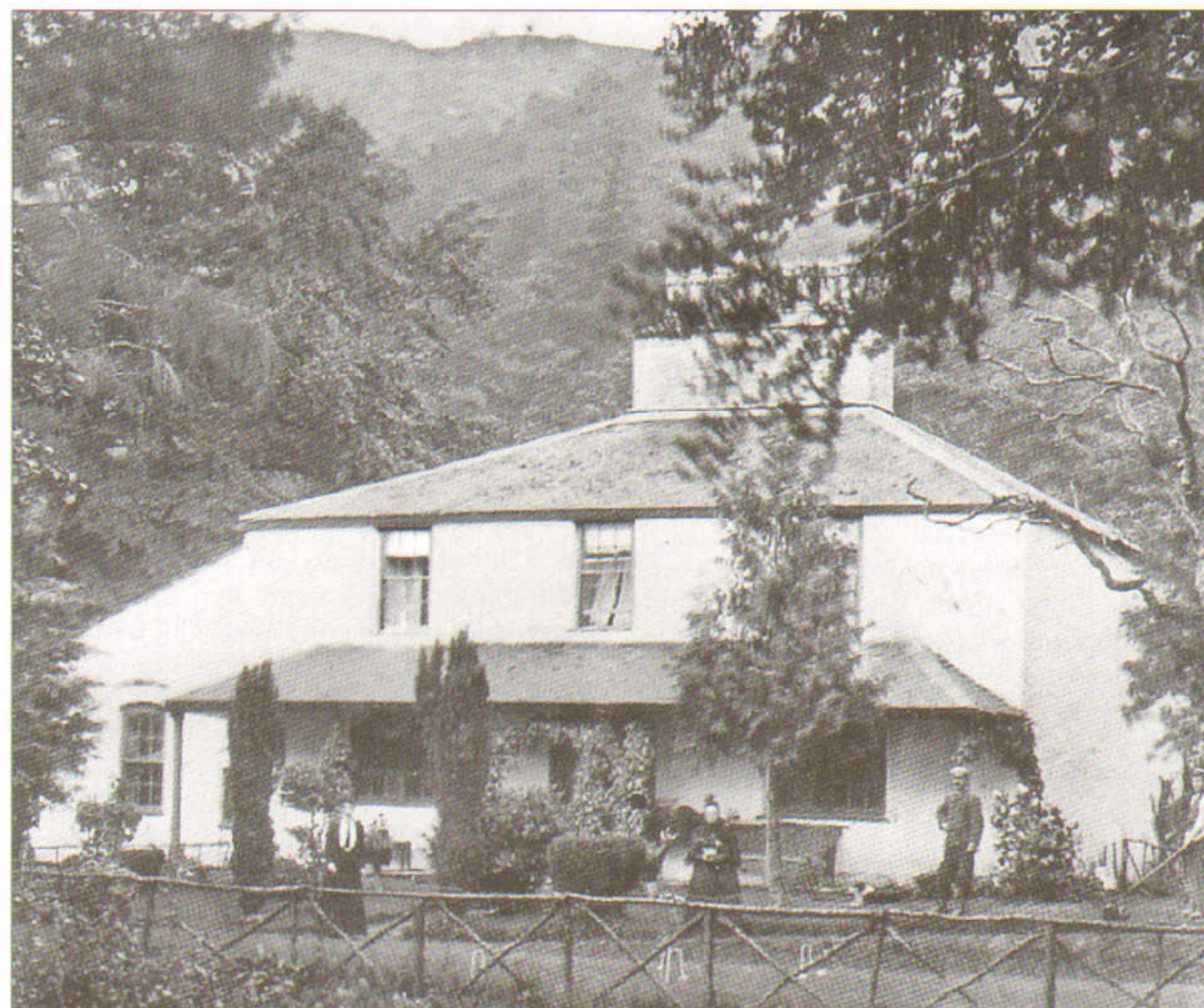
Glasgwm Hall gyda Chwm Glasgwm yn y cefndir

Wedi dweud y gyfrinach roedd mam yn aml yn dyfalu beth oedd wedi digwydd i'w thaid. Tybed a oedd ganddo ddisgynyddion yn America? Roeddwn wedi penderfynu chwilio am y teulu ar ôl ymddeol – er y byddai fel chwilio am nodwydd mewn tās wair.