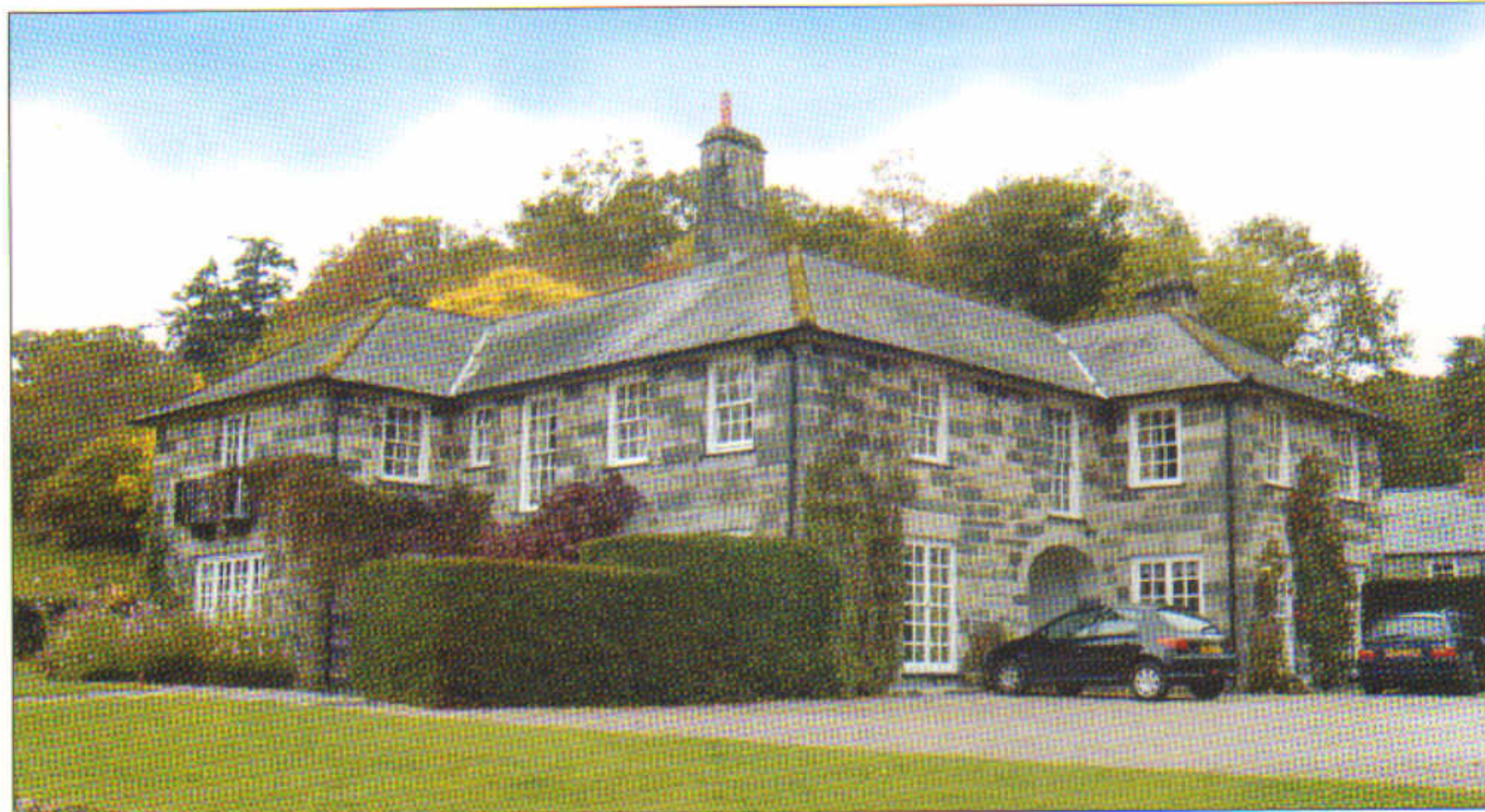
Plas y Rhiwlas fel y mae heddiw a adeiladwyd ar yr un safle â'r hen un.

feddwl o'r ceffylau na gweddill y teulu! Mae gen i frith gof o'r hen dŷ. Syr Clough Williams-Ellis oedd pensaer y plas presennol a gellir gweld ei arddull unigryw yma ac acw. Achubwyd distiau derw o'r hen blas ac maent i'w gweld yn neuadd y tŷ presennol.