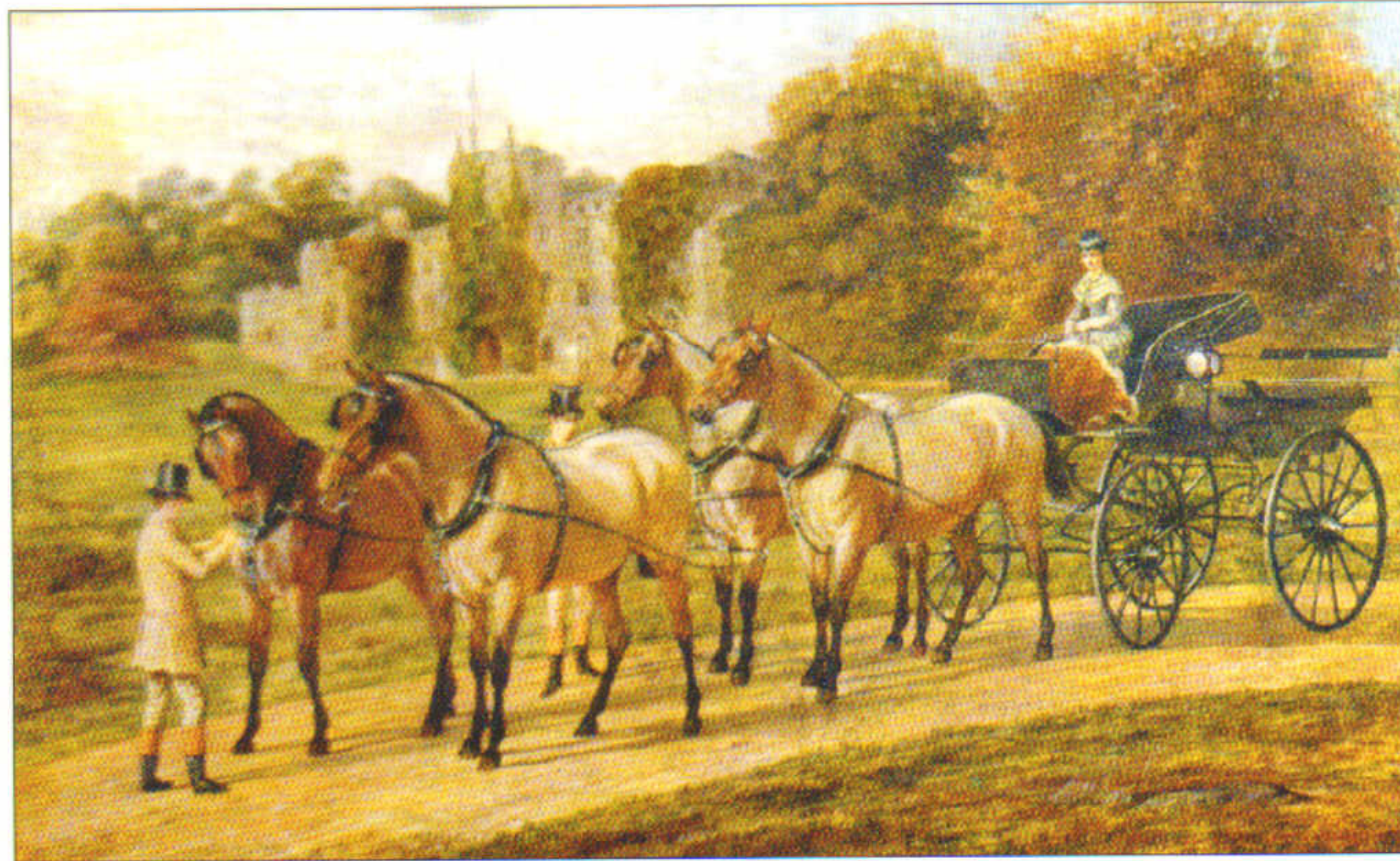
Plas y Rhiwlas cyn ei ddymchwel yn 1953

Codwyd y plas presennol ym 1954 wedi i'r plas castellog, llaith, gael ei ddymchwel. Roedd deg ar hugain o ystafelloedd yn yr hen blasty a llosgwyd tunnelli o lo bob dydd i gadw'r tŷ yn gynnes. Dim ond yn y stablau yr oedd gwres. Mae'n amlwg fod yna fwy o