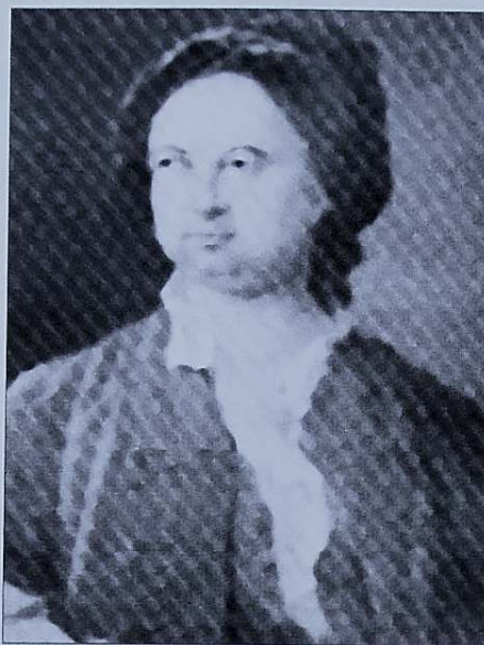
Lewis Morris (1701-65)