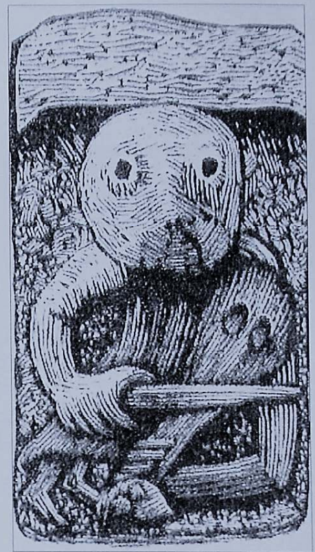
Cerfiad o Grythor ar fur gogleddol y gilfach.