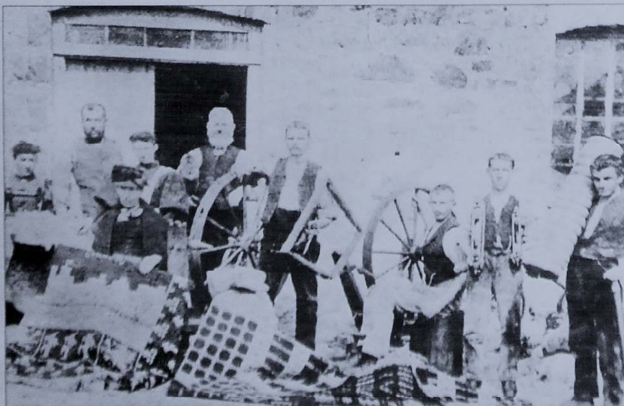
Gweithwyr Ffatri Wlân Pwllheli tua 1890