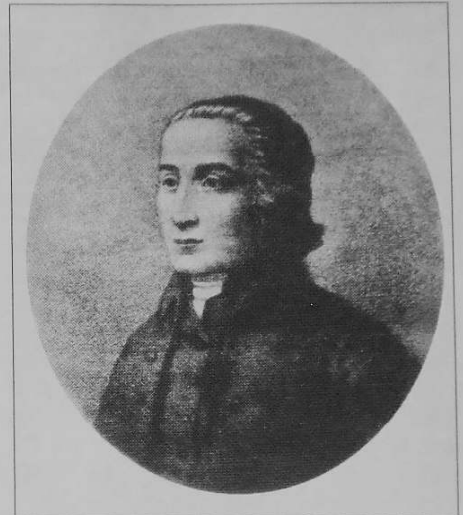
Y darlun o Williams Pantycelyn a ymddangosodd yn Holl Weithiau Williams , 1867 (o Y Tadau Methodistaidd , Cyfrol I, 1895)