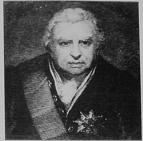
Joseph Banks (1744-1820)