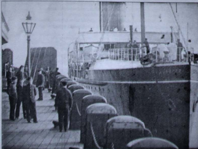
Y llong 'Munster' yn cyrraedd Caerdybi (o ffilm gan Arthur Cheetham, 1898)