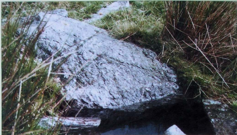
Ffynnon Doctor Mynydd.

Yn ystod y bedwaredd ganrif ar bymtheg trigai dau feddyg, tad a mab o'r un enw, sef