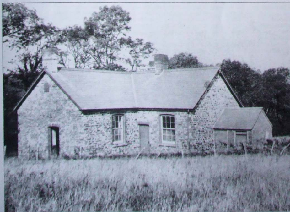
Ysgol Ramadeg, Pencader (o Almanac yr Hen Gapel, Pencader 1980).