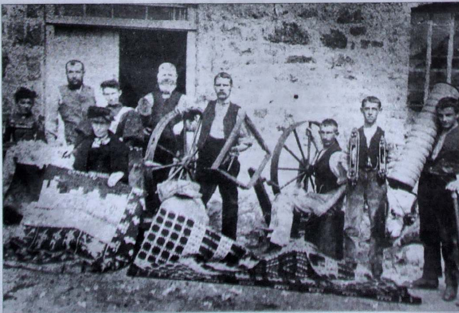
Gweithwyr Ffatri Wlan, Pwllheli c. 1898-9.