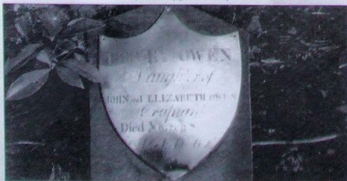
Plât Arch Bronfair