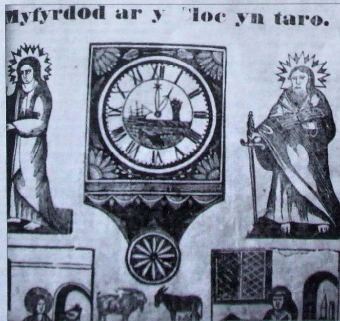
Llun 2: Rhan o wyneb-ddalen Myfyrdod ar y Cloc yn Taro gan Azariah Shadrach.

Fel rheol, wrth gwrs, nid oes unrhyw ddarn o bapur neu gerdyn yn y casyn sy'n taflu goleuni ar hanes hen gloc, ond byddai'n braf clywed gan ddarllenwyr llygad-barcud Y Casglwr am fanylion unrhyw effemera, megis labeli neu gardiau masnach seiri Cymreig. Os gwelwch yn dda, ffoniwch yr awdur ar 029 20 843200.