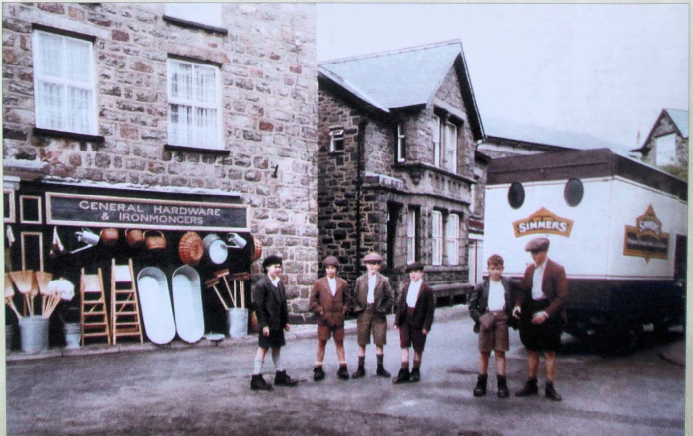
Golygfa o'r ffilm Eldra yn Nolgellau.