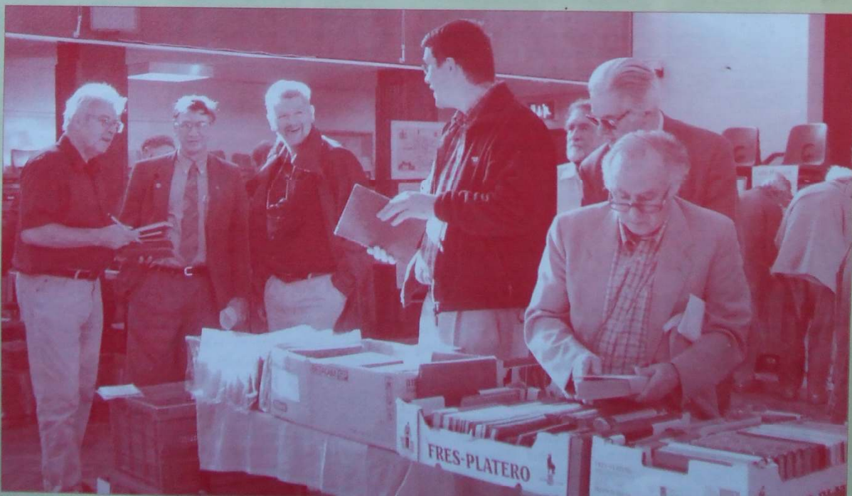
Allwch chi enwi'r llyfrbryfed?

Cofiwch am wefan Y Casglwr ar www.geocities.com/casglwr Os ydych am gyfrannu iddo, gyrrwch eich pytiau at y golygydd drwy'r ebost tanycastell@yahoo.com