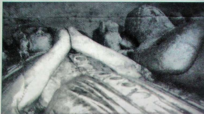
Delwau alabaster o ewythr a modryb Owain Tudur yn Eglwys Penmynydd. Naddwyd yr alabaster i wneud eli llygaid.

ac yn filwyr profiadol, a dyna'r sefyllfa ym Môn pan gododd Owain Glyndŵr ym Medi 1400 ar y gororau. Yr oedd Môn yn barod i'w helpu oherwydd y tyndra rhwng y Cymry a'r Saeson, yr anawsterau a ddilynodd y Pla Du a'r siom ar yr ynys ar ôl llofruddiaeth Owain Lawgoch yn Ffrainc.