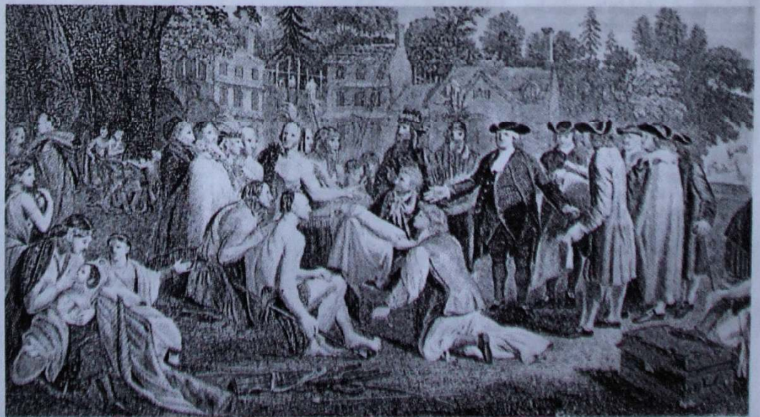
Cytundeb Penn â'r Indiaid