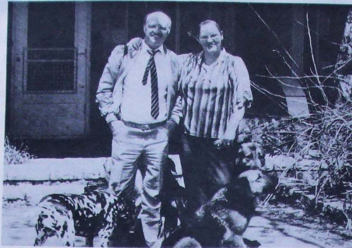
Yr awdur yng nghwmni Luella (merch Murray the Hump)

roedd Capone ('uncle Al') yn lletya ar y pryd. Dros yr adran hon o'r ffilm roedd Humphreys wedi gosod y gân 'The Gang's all Here!'