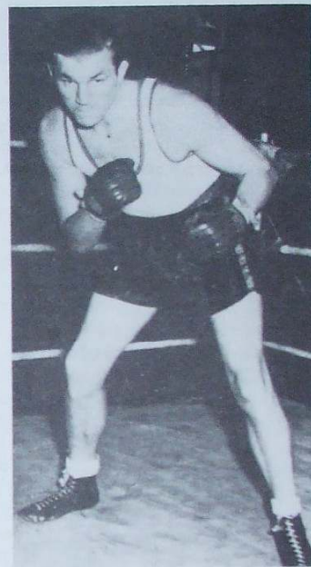
Tommy Farr, 1950.